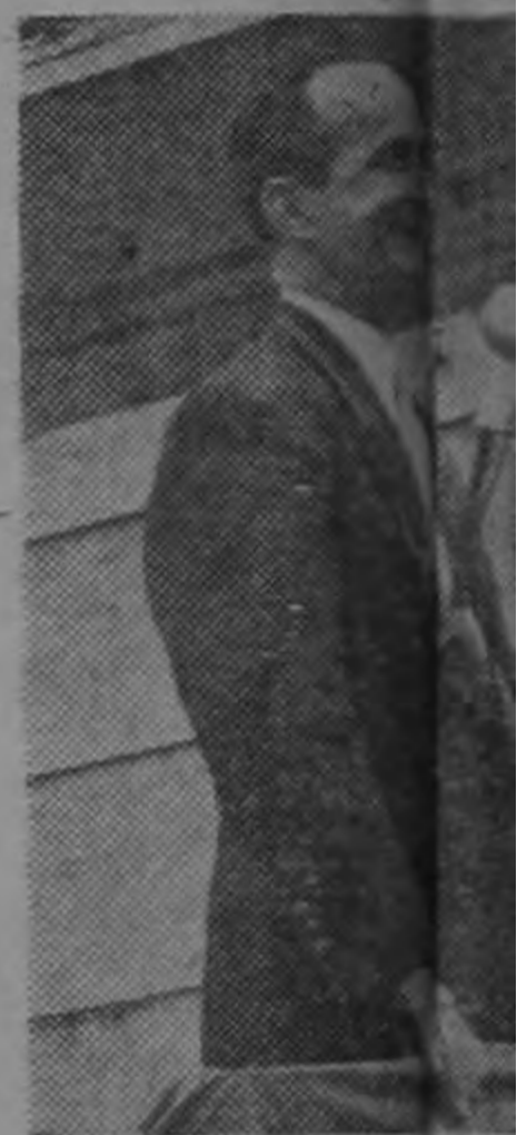
DON JOSE FIG