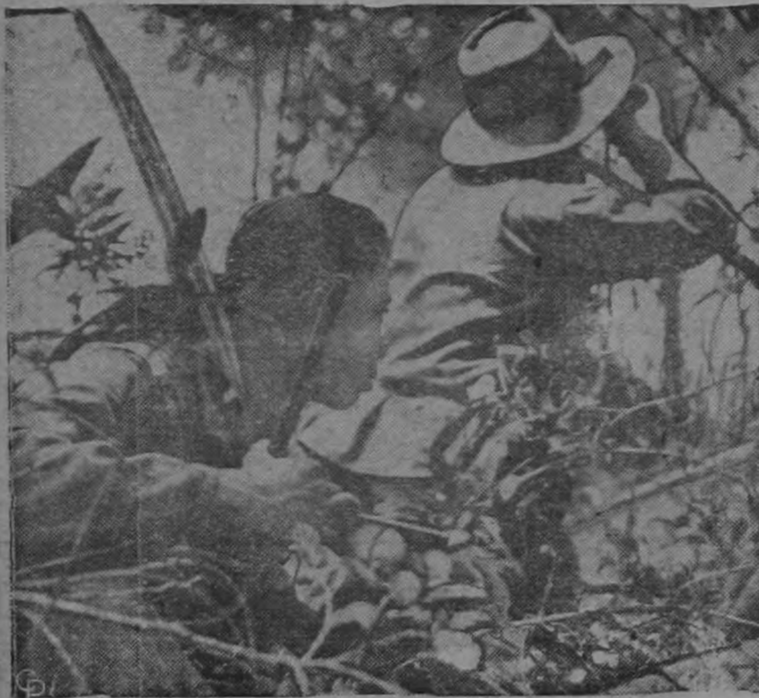
La espesa vegetación protege a estos "comandos" de las tropas francesas en misión de reconocimiento en la región de Sam Neua en el frente de combate de la Indochina.—(INP).