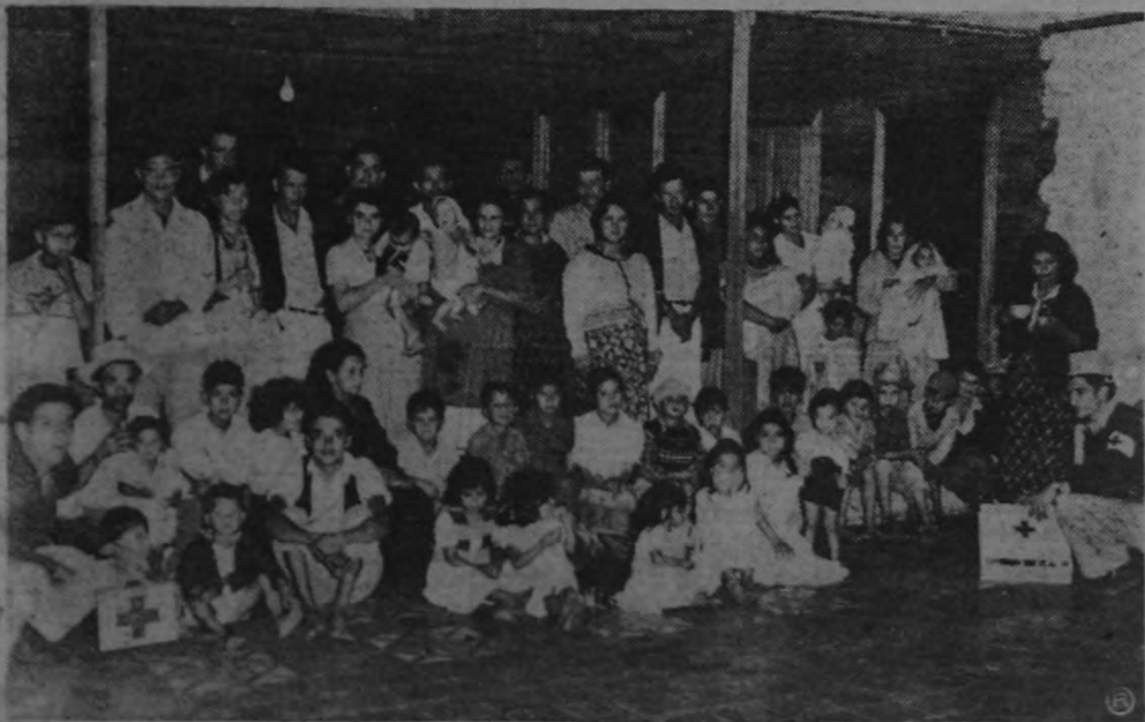
REFUGIADOS EN CORONADO.—Presentamos algunos aspectos de la asistencia que se está prestando a los damnificados por el terremoto. En la foto de arriba, una de las familias alojadas en el local del Club Uruguay: uno de los niñitos duerme apaciblemente, mientras los otros parecen contagiados de la preocupación de los mayores. En la vista siguiente, una de las Damas Blancas y una auxiliar de la Cruz Roja se ocupan de preparar los alimentos para los refugiados, en el Preventorio (ver foto). En la foto de abajo, el numeroso grupo de personas que han encontrado temporal alojamiento en el Club Uruguay.