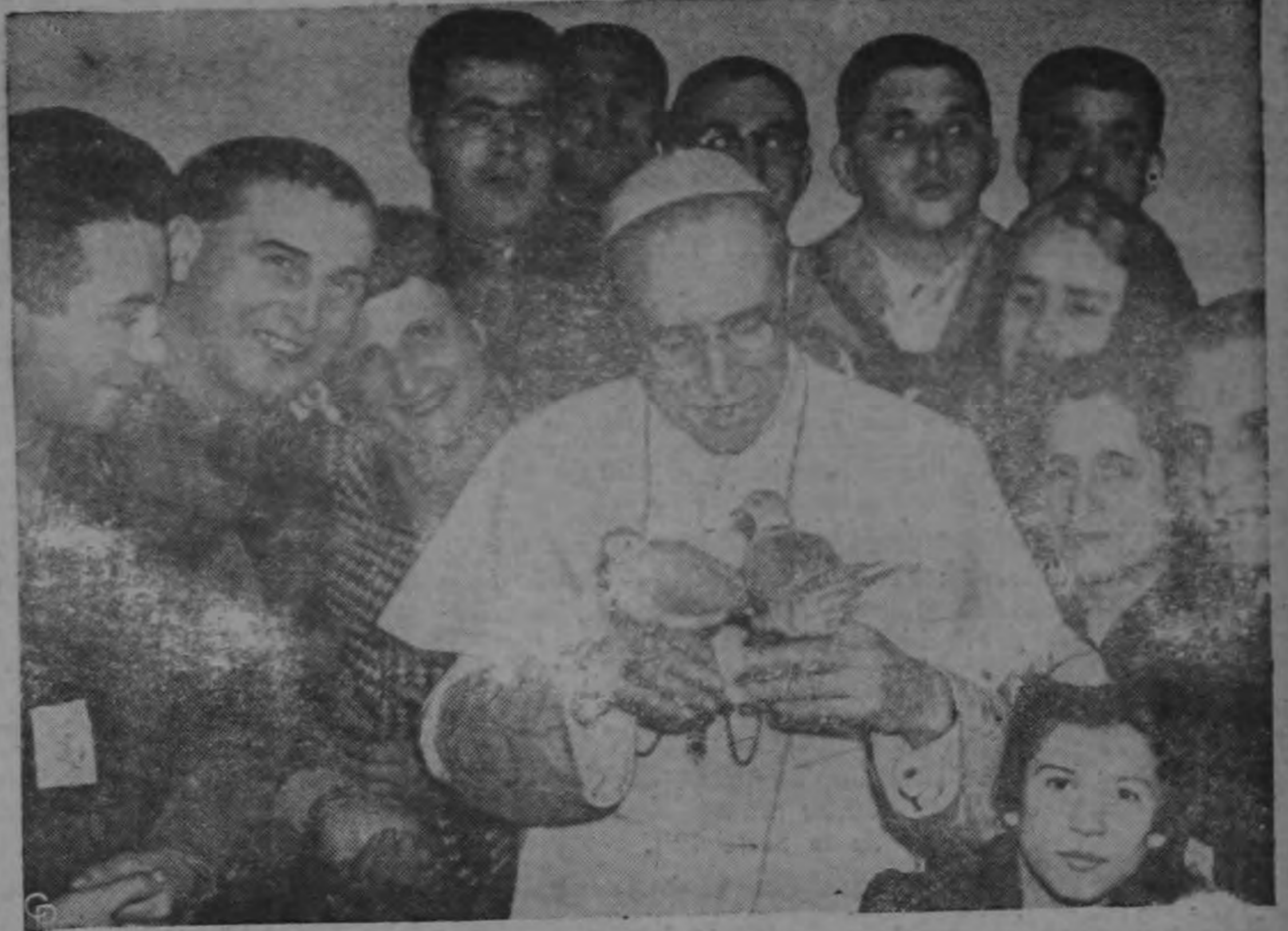
Dos palomas, símbolos de la paz, son obsequiadas al Papa Pio XII por la Tercera Orden de Franciscanos en una audiencia especial en San Pedro, Roma.—(INP).