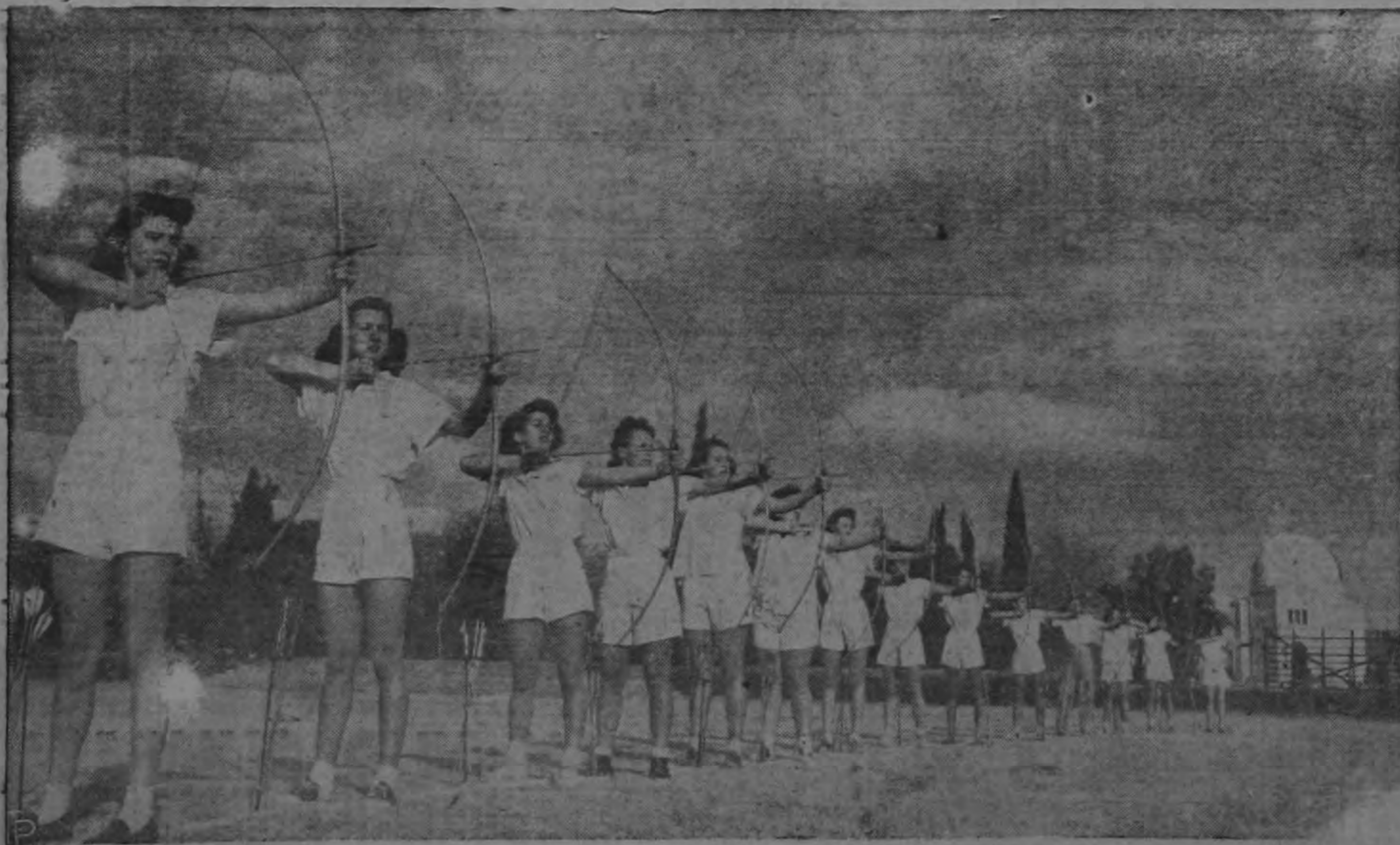
Alumnas de la Universidad de Arizona, en Tucson, hacen ejercicios de tiro al arco. El programa de cultura física es desarrollado al aire libre todo el Invierno bajo el Sol de Arizona.