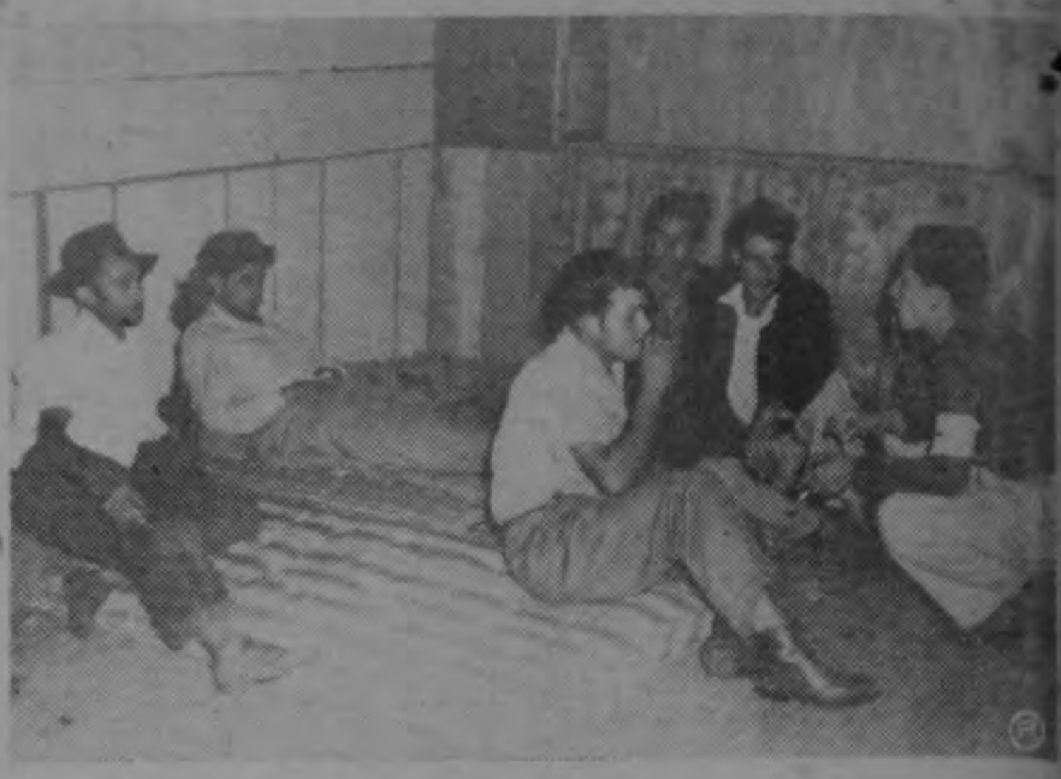
Algunos de los refugiados en el Club Uruguay esperan con impaciencia el momento de regresar a las fincas en que trabajan y de las cuales hubieron de salir a consecuencia del terremoto del 30. También los propietarios de las fincas tienen gran urgencia de que vuelvan a sus labores.