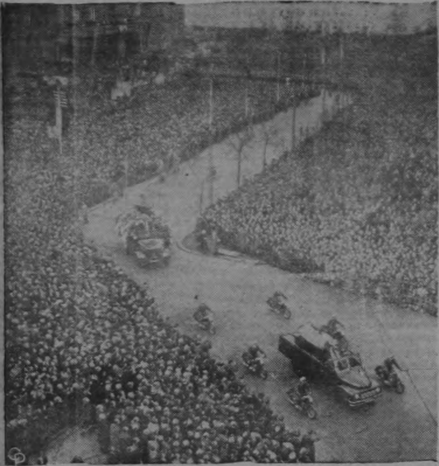
Millares de personas presencian el paso del cortejo fúnebre de Herbert Bauer, policía de Berlín Occidental asesinado por soldados soviéticos el día de Navidad. El policía murió al tratar de impedir que tres berlineses occidentales fuesen raptados y llevados al otro lado de la frontera. Todas las banderas fueron colocadas a media asta y se pusieron cintas de luto en las casas.