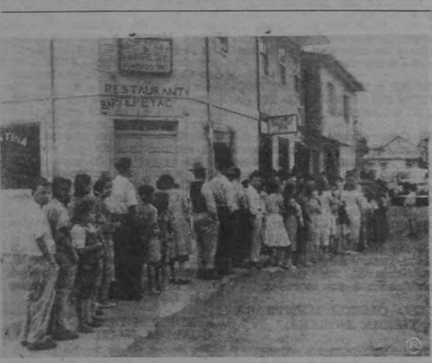
Ayer hubo sal en los Estancos, y, como un índice de la angustiosa demanda, se formaron de súbito grandes colas.

Durante el día de hoy llegaron otros cargamentos hasta completar los 750 quintales.